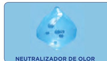
NEUTRALIZADOR DE OLOR