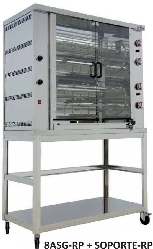
8ASG-RP + SOPORTE-RP

ALTO RENDIMIENTO COMPACTO BAJO CONSUMO MUY VERSÁTIL