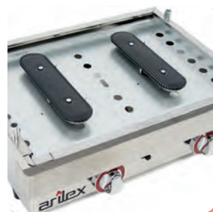
Quemadores ARILEX ARILEX Burners Brûleurs ARILEX