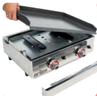
Placa de Cocción Extraíble Removable Cooking Plate Plaque de Cuisson Extractible