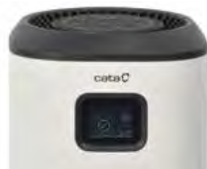
Pantalla táctil TFT