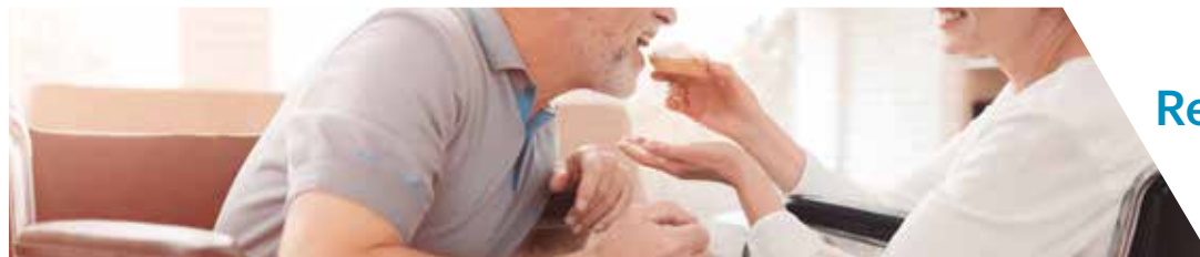
Residencias de ancianos