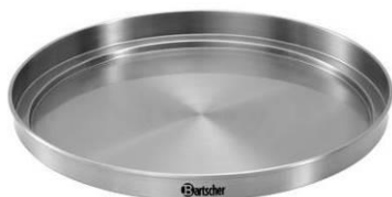
Tapa calentadora para las tazas (no está provista)