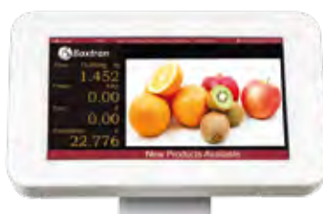
Pantalla comprador 7"