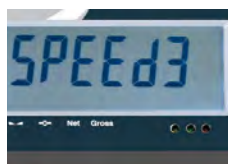
Función: Convertidor de velocidad