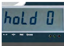
Función: Hold (4 modos)