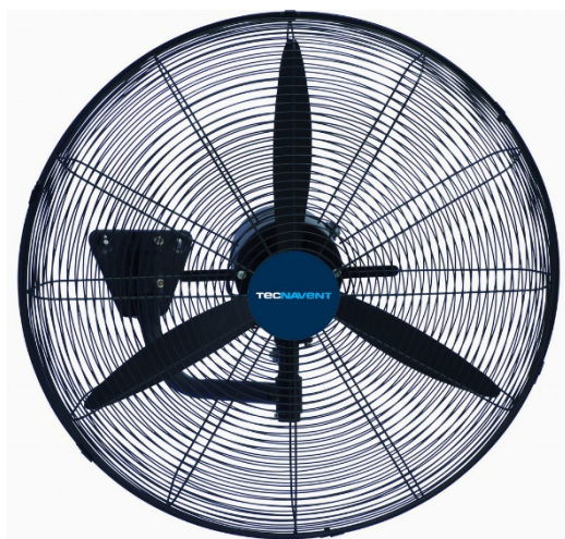
Mod. BDFP 500 / 600-TW