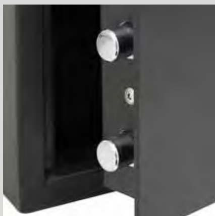
2 bulones Ø18 mm

Su diseño minimalista, su variedad de acabados y su sencillo manejo la convierten en una muy buena opción para todo tipo de hoteles.