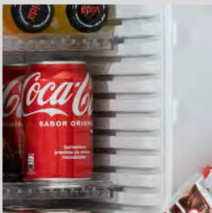
Bandejas regulables en altura

Su acabado en acero inoxidable lo hace especialmente resistente a los golpes. Silencioso y eficiente.