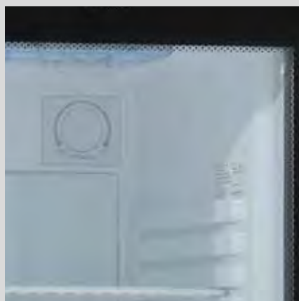
Detalle del interior