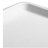
Diseño de perfil bajo