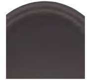
Diseño de perfil bajo Ovalada