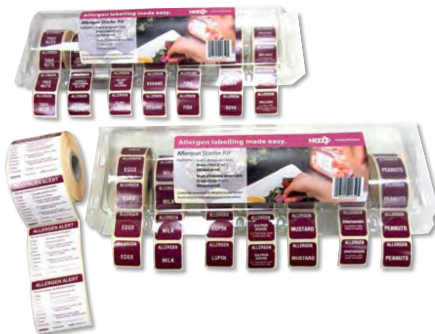
Kit etiquetas despegables ALÉRGENOS