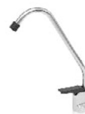
Grifo Estándar (incluido en el Minicool)