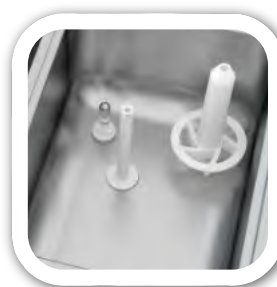
Depósito refrigerado con agitador