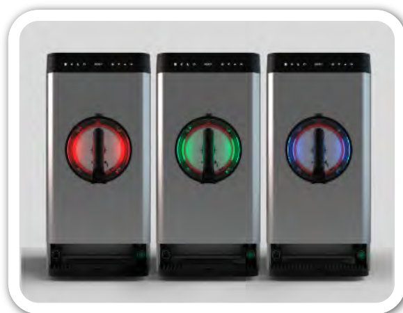
Cilindro retro-iluminado opcional