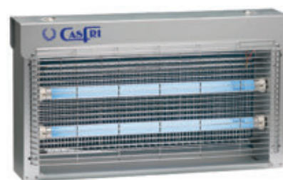
DT-15 TOTAL INOX.

Área de cobertura: 500 m 2 . aprox. Consumo: 2x15 W. = 30 W. Tensión parrilla: 2.900 W. Número de tubos: 2