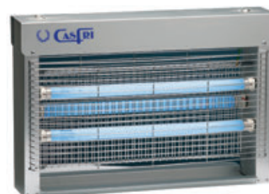
DT-22 TOTAL INOX.

Área de cobertura: 750 m 2 . aprox. Consumo: 3x15 W. = 45 W. Tensión parrilla: 5.000 W. Número de tubos: 3