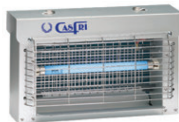
T-11 TOTAL INOX.

Área de cobertura: 125 m 2 . aprox. Consumo: 1x11 W. Tensión parrilla: 2.500 W. Número de tubos: 1