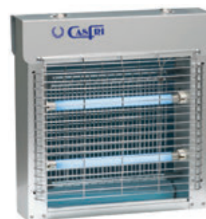
DT-11 TOTAL INOX.

Área de cobertura: 250 m 2 . aprox. Consumo: 2x11 W. = 22 W. Tensión parrilla: 2.500 W. Número de tubos: 2