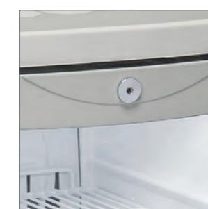
Cerradura de serie.