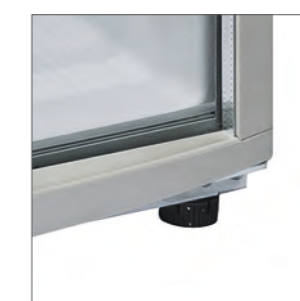
Patas regulables en dotación.