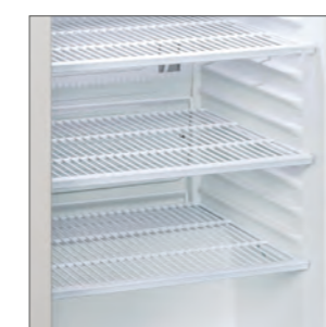
RCF 145: puede contener 139 latas de 33cl.