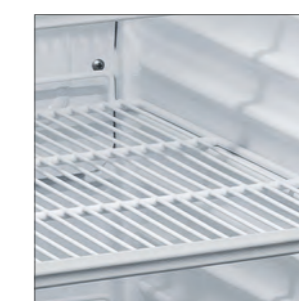
Estantes regulables en altura.