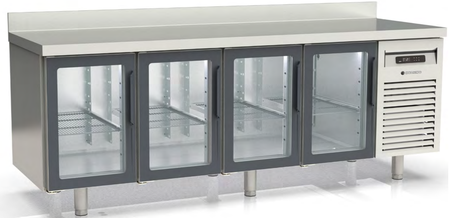
MRGV-250 dotación parrillas y contenedores extra with extra containers and shelves