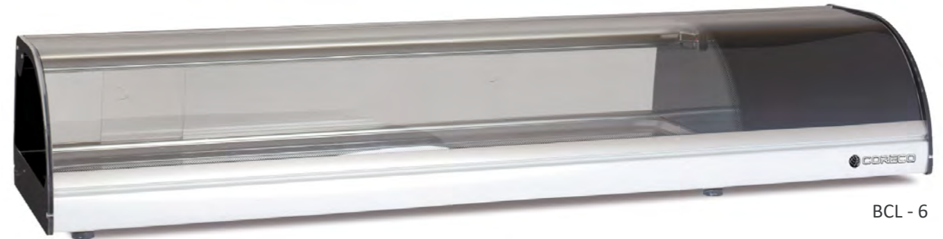
BCL - 6