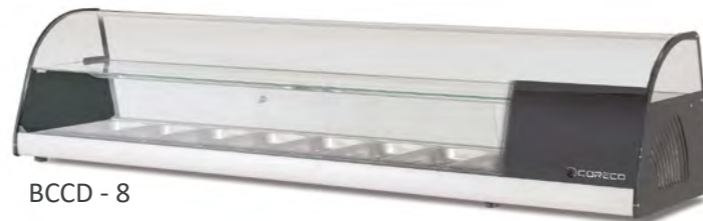
BCCD - 8