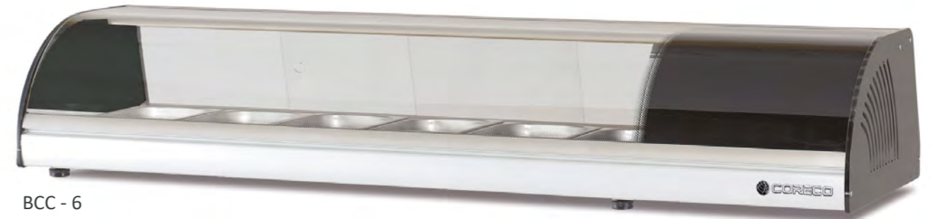
BCC - 6