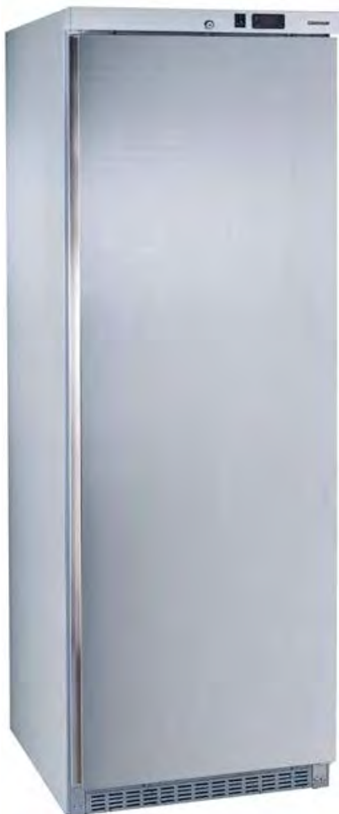
MAC460 PO A