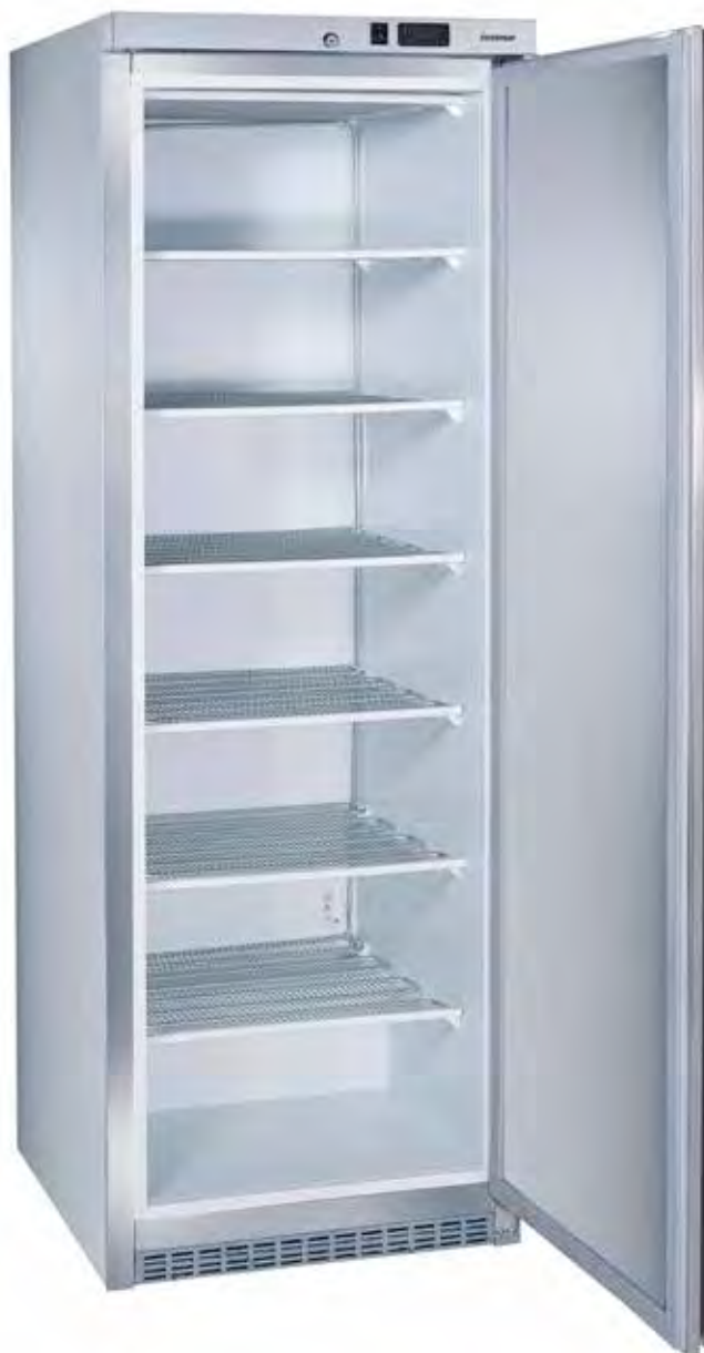
MAC460 PV BL