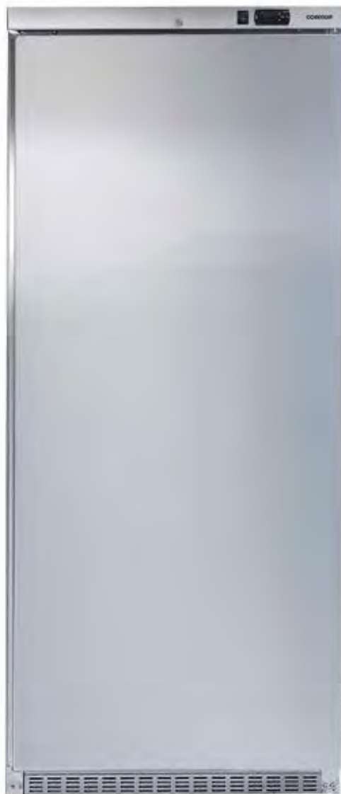
MAC600 PO A