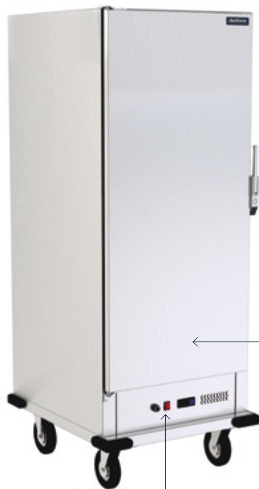
Panel de mandos Panel con interruptor luminoso de puesta en marcha y termostato regulador de temperatura de 0°C a 90°C.

Ruedas de Ø150 mm, 2 de ellas con freno. Aptas para cualquier pavimento.