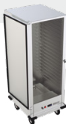
Tirador con cierre y llave incorporada.

Bisagras superiores e inferiores de acero inoxidable con punto pivote de giro para conseguir una apertura total de la puerta