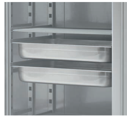
DETALLE CUBETAS 1/1 DETAIL CUVETTES 1/1 DETAIL BOLS 1/1