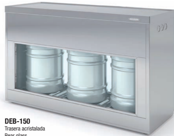
DEB-150 Trasera acristalada Rear glass Vitre arrière