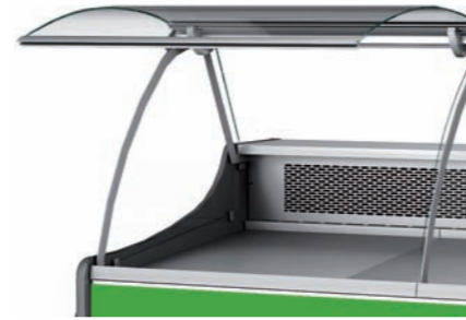
detalle cristal elevable detail lifting glass detail vitre rabattable