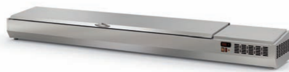
Detalle tapa cerrada Closed lid detail Détail du couvercle fermé