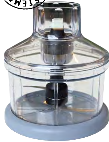
Bol Cutter Junior

Referencia AC104 Velocidad rpm 600 / 2 500