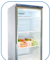
Cestas armarios 600.