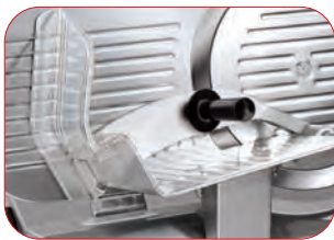
Protecciones para el usuario.