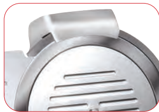
Afilador fijo ( excepto CGSP-195 E )