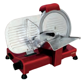
CGSP-250-R E lacada en rojo.