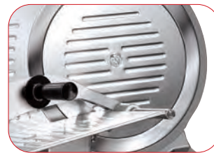
Anillo protector fijo.