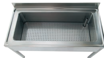
Gran capacidad de trabajo. Excelente calidad de materiales.