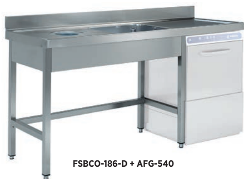
FSBCO-186-D + AFG-540