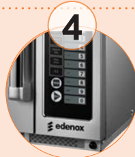
Filtro de aire desmontable. (modelo 1834)