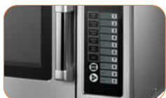
Panel de control "Touch" con led display, tres niveles de potencia.