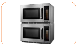
El modelo de 34 litros permite remontar los microondas.