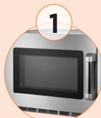
Cristal externo para poder visualizar el producto