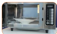
Base cerámica plana