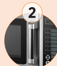
Asa ergonómica, que realiza el diseño del microondas