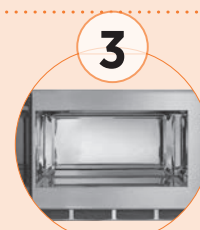
Cámara en acero inoxidable