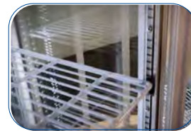
4 estantes plastificados blancos regulables en altura.