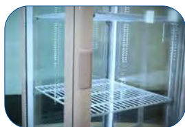
La vitrina dispone de doble tiras de LED en el interior.