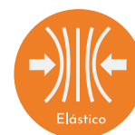
Tabla de medidas