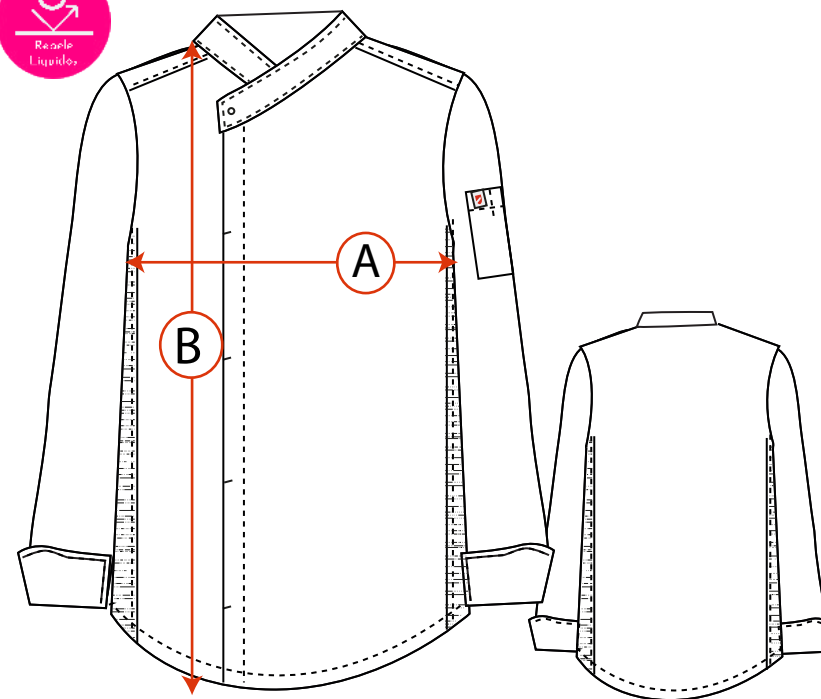
Tabla de medidas