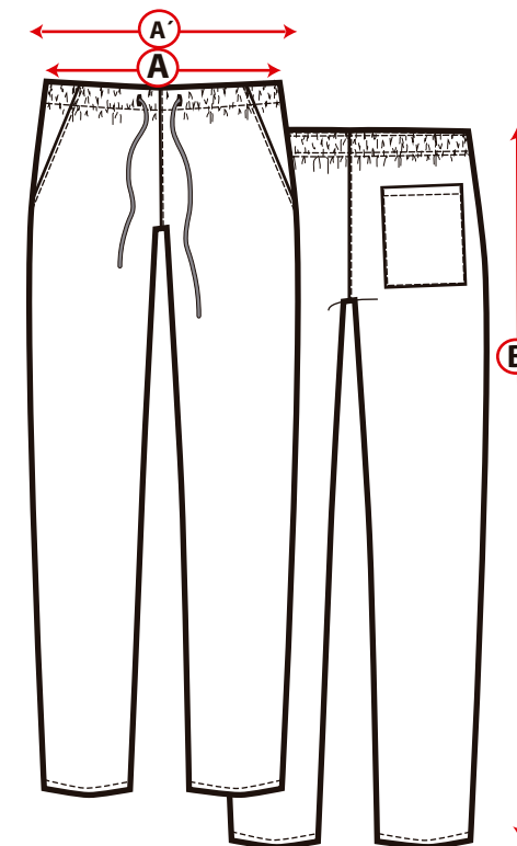
Tabla de medidas