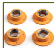
Círculos de metal para proteger los ejes