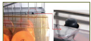
Interruptor de seguridad