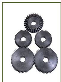
Engranajes de metal