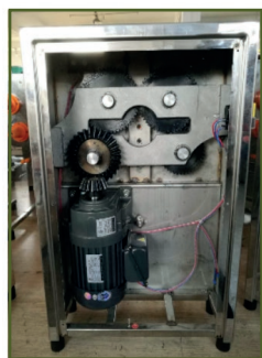
Caja de engranajes para arreglar los engranajes.