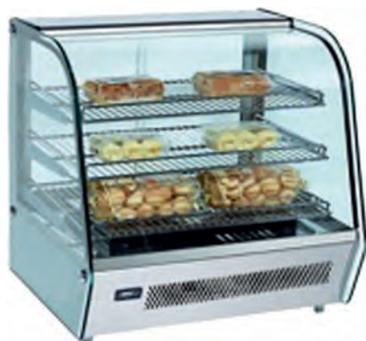
VITRINA CALIENTE RTR-120L