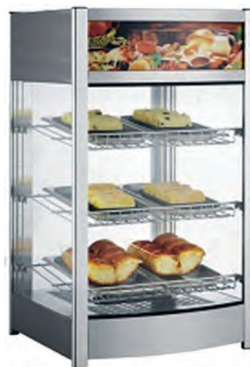
VITRINA CALIENTE RTR-97L