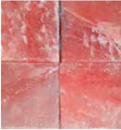
BLOQUE SE SAL HIMALAYA 200 x 200 x 30 mm. (En la foto vemos 4 unidades). · FMA-1650: 4 unidades como dotación · FMA-900: 2 unidades como dotación