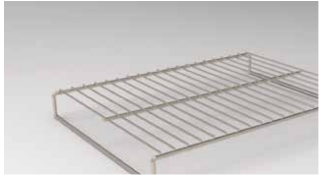
12240795 - PARRILLA INF MC-1000: · 558 x 413 x 62,5 mm gris para FMA-1650