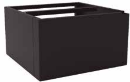
19074043 - PEANA FMA-1650 B 19081970 - PEANA FMA-900 B