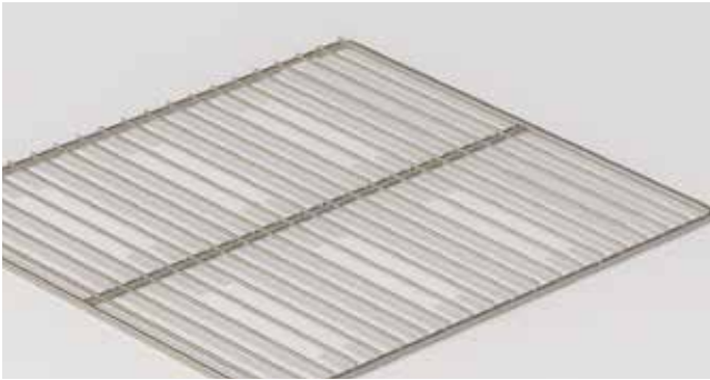
12240791 - PARRILLA MC-1000: · 487 x 582 mm para FMA-1650