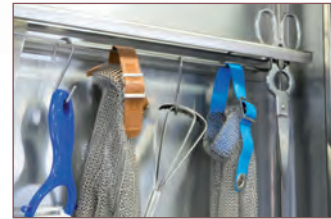
Barra para colgar accesorios.

Utensil rack. Barre pour accrocher des accessoires.