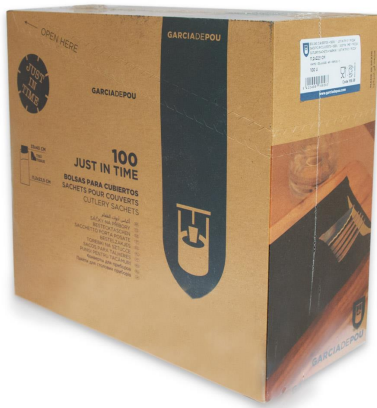
Imagen de paquete