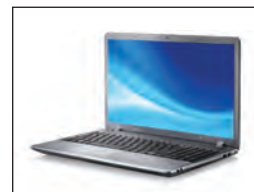
Ideal para ordenadores portátiles. HS458-02 hasta 15 pulgadas, HS470-02 hasta 17 pulgadas