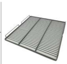
AEX 1000 T/F

Parrilla reforzada Reinforced shelves Grille renforcée