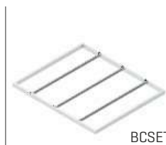
AN 1002 SC