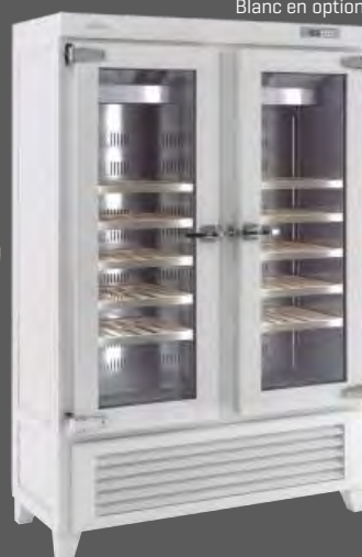
EVV 49 R2G

Blanco opcional Option white Blanc en option