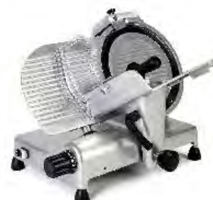
C 350 SCEV