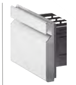
EBC 1000 II