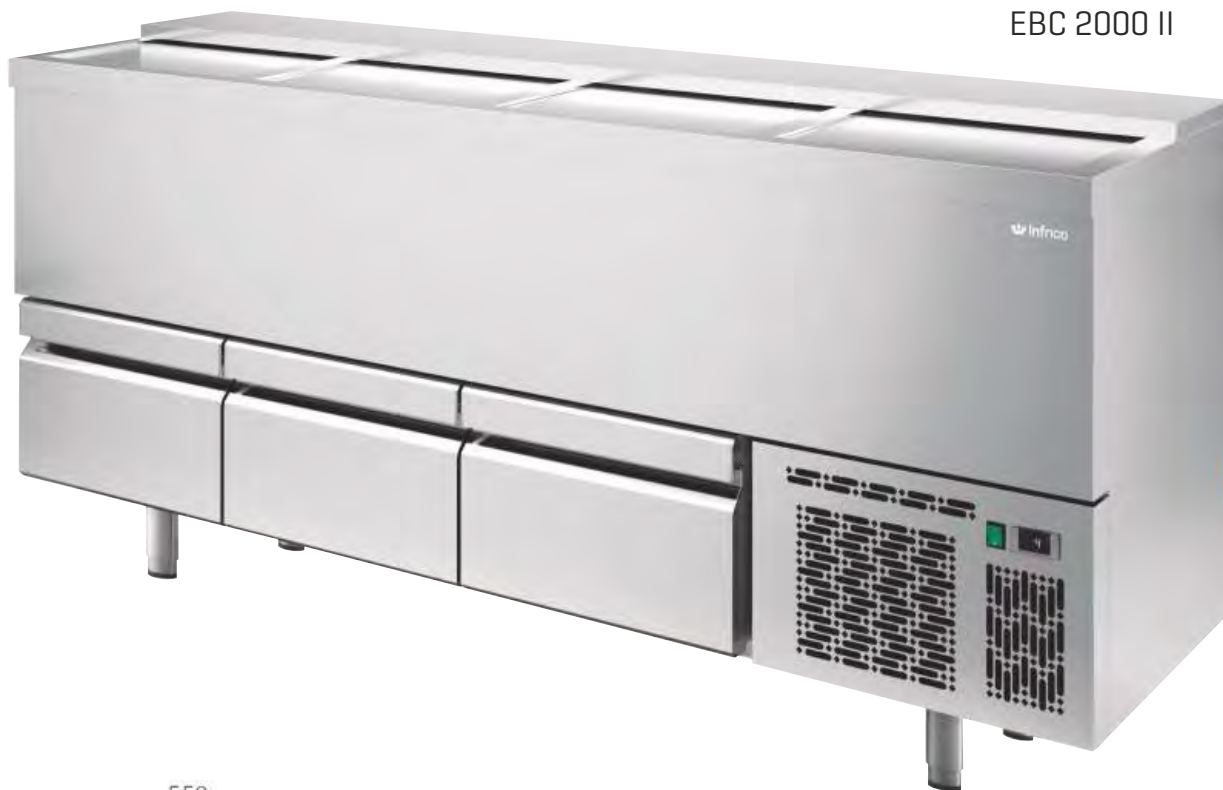
EBC 2000 II