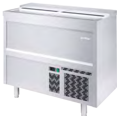
EB 1000 II