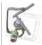
Bomba de lavado DuFlo Washing pump DuFlo