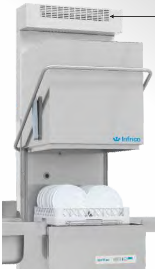
Con accesorios opcionales, pag. 578-579

Modelo LCP4550EDBDRC con Recuperador de Calor RC