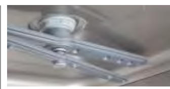
Brazo lavado y aclarado superior modelo LVP3250 Upper washing and rising arm model LVP3250