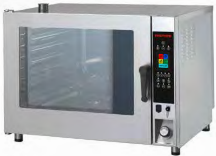
Mod. CDT 207 E