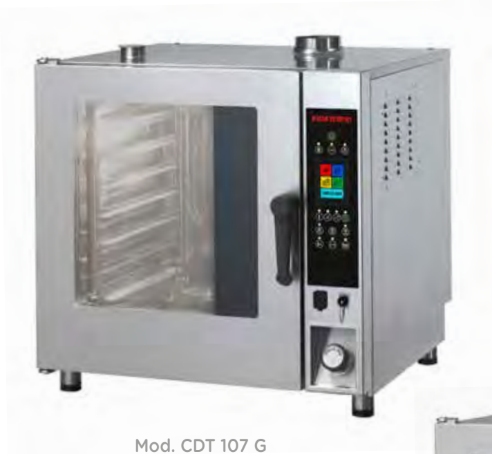
Mod. CDT 107 G