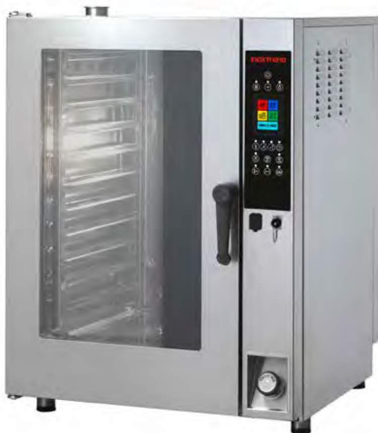
Mod. CDT-111 E