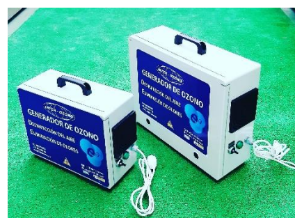
Portátil – 1

GARANTIA : 2 años. FABRICACION : NORMA AENOR UNE ENTREGA : ± Una semana