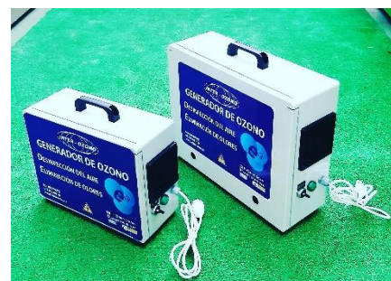
Portátil – 1

GARANTIA : 2 años. FABRICACION : NORMA AENOR UNE ENTREGA : ± Una semana