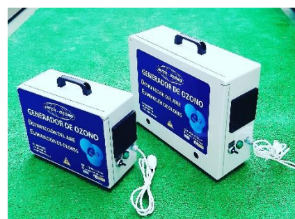
Portátil – 1

GARANTIA : 2 años. FABRICACION : NORMA AENOR UNE ENTREGA : ± Una semana