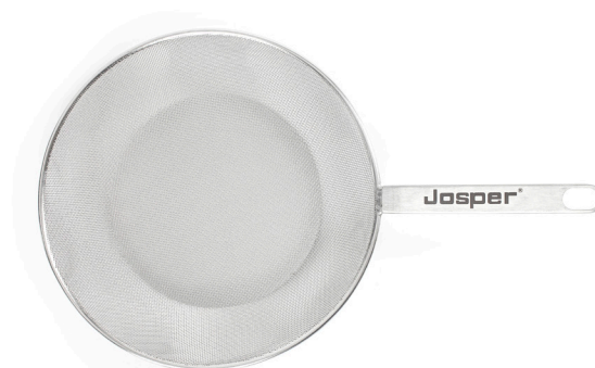
SARTÉN DE MALLA METÁLICA DE AGUJERO FINO