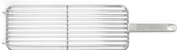
PARRILLA RECTANGULAR DOBLE