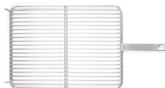
PARRILLA CUADRADA DOBLE