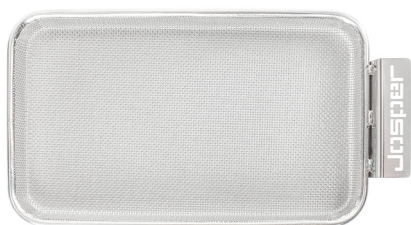
MINI PARRILLA PINZA MICROPERFORADA