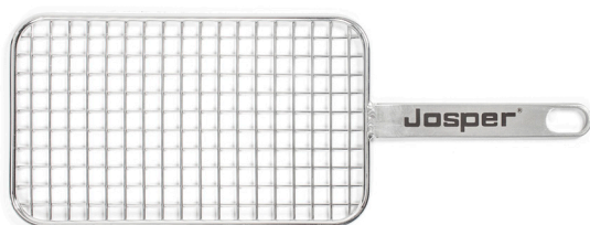
MINI PARRILLA SIMPLE