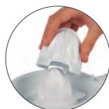
Dos conos intercambiables Two different-sized interchangeable