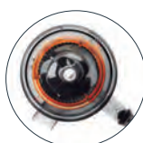
Exprime frutas y verduras enteras Whole fruit / vegetables