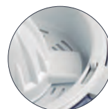
Sistema de pulpa regulable Adjustable pulp system